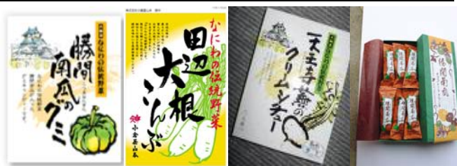
第2図 伝統野菜を素材とした加工食品