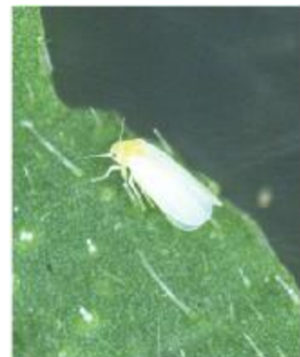
トマトで発生したトマト黄化病(左)とタバココナジラミ(右)