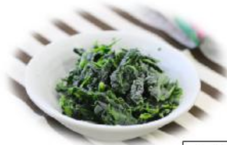
冷凍シュンギクの写真