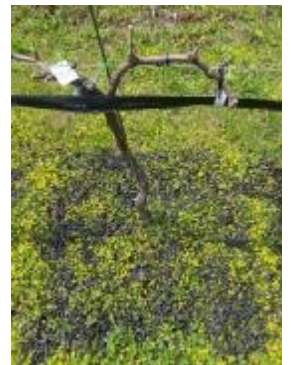
ブドウ剪定枝の炭化のようす