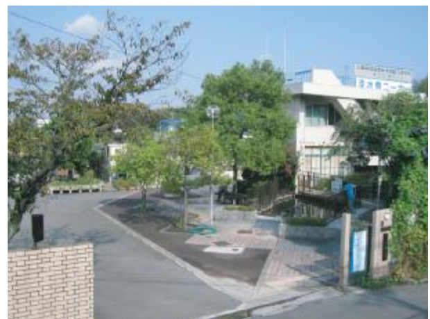
水生生物センター