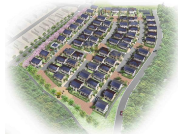
晴美台エコモデルタウンイメージ