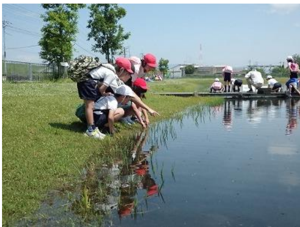
ビオトープでの生き物観察