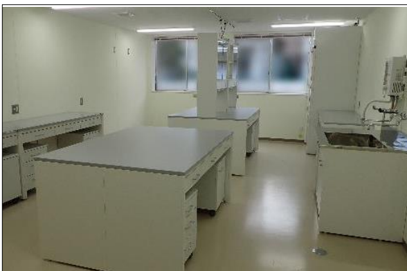
実験室1（生物実験室）