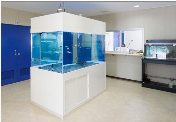
展示水槽（玄関ホール）