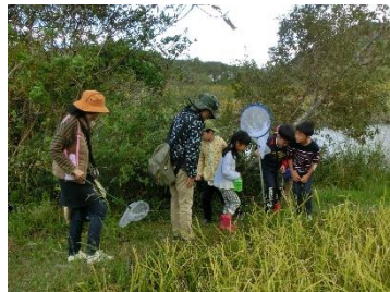
多奈川ビオトープ

ファミリー向けのコースを新設！ 家族で参加できるハイキングです。 多奈川ビオトープで自然観察会を 開催！日頃見られないいきものと ふれあおう！