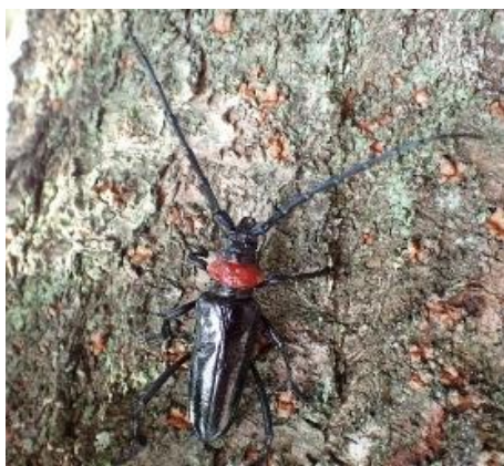
クビアカツヤカミキリ

また、府内各地で捕獲イベント ※2 を開催します。大阪のサクラ、ウメ、モモをみんなで守っていくためにぜひご参加ください。