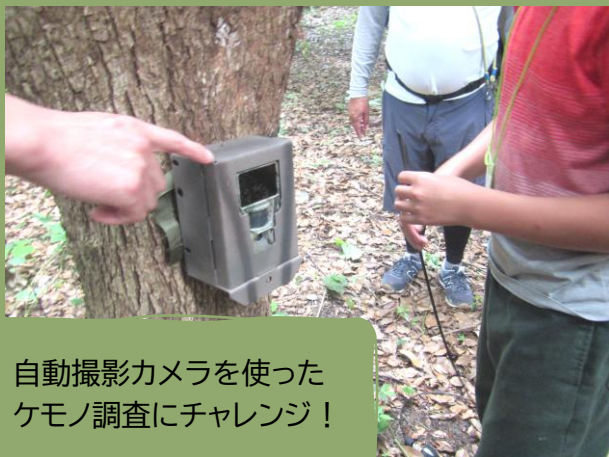
自動撮影カメラを使った ケモノ調査にチャレンジ！