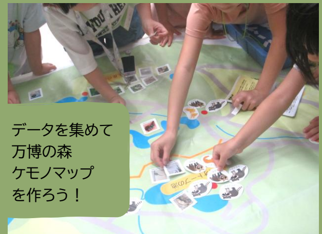
データを集めて 万博の森 ケモノマップ を作ろう！