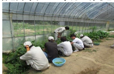
実習(インゲンの収穫)