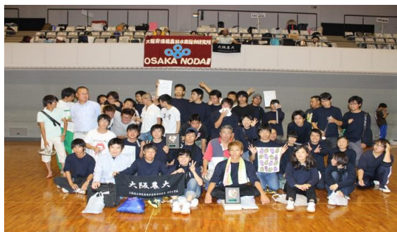
東海近畿地区農業大学校学生スポーツ大会(滋賀県)

(2) その他 教科書、実習服、農家実習、校外学習、教育後援会、傷害保険等約150,000円(1年次)、約130,000円(2年次) 入学検定料及び入学金は不要です。