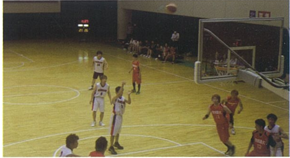
東海近畿地区農業大学校学生スポーツ大会(岐阜県)