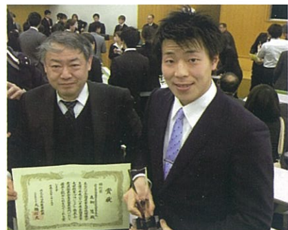
全国農業大学校意見発表で