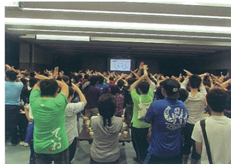
東海近畿地区農業大学校学生スポーツ大会大阪大会(交流会)