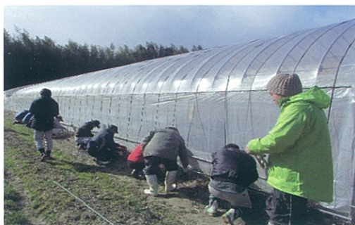
野菜ハウスの実習

(2)その他 教科書、実習服、農家実習、校外学習、教育後援会、傷害保険等 約150,000円(1年次)、約130,000円(2年次) 入学検定料及び入学金は不要です。