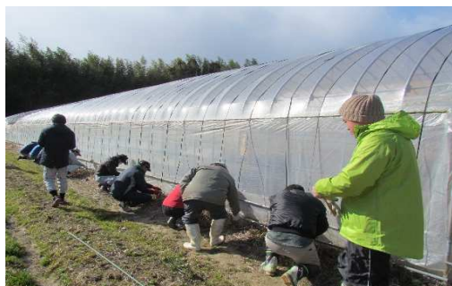
野菜ハウスの実習

(2) その他 教科書、実習服、農家実習、校外学習、教育後援会、傷害保険等 約150,000円(1年次)、約130,000円(2年次) 入学検定料及び入学金は不要です。