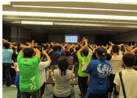
東海近畿地区農業大学校学生スポーツ大会大阪大会(交流会)