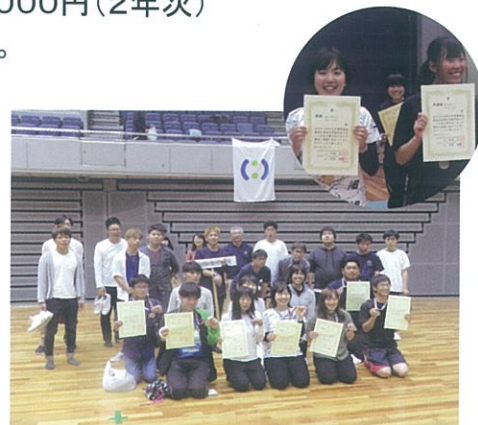
東海近畿地区農業大学校 スポーツ大会 三重大会 (令和元年)