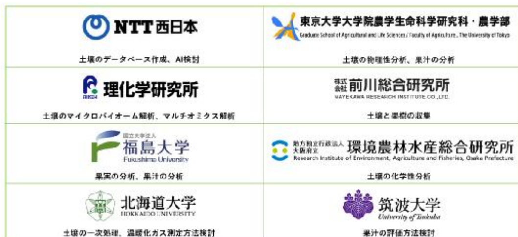
図 2 共同研究における役割分担