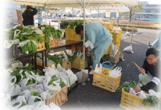
農業祭では、自分たちが がんばって育てた農産物や手 料理を販売します。