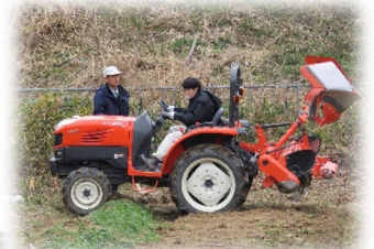
実習では農業に必要な 機械の操作実習も行い ます。