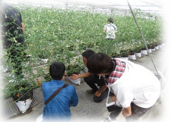
校外実習では、近隣の先進地農業 を視察します。