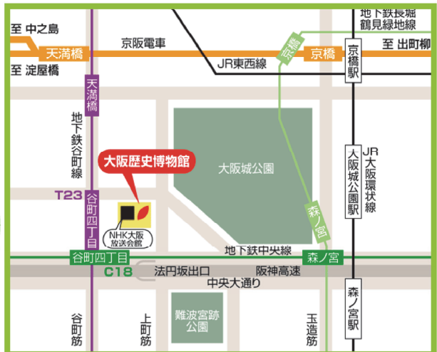
会場は公共交通機関を利用してお越しください