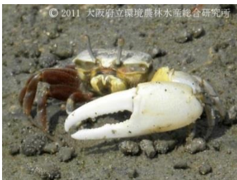
ハクセンシオマネキ

また、「がっちょ」の住み家は？ 生活は？ 漁獲方法は？ など「がっちょ」の生態についてお話しします。