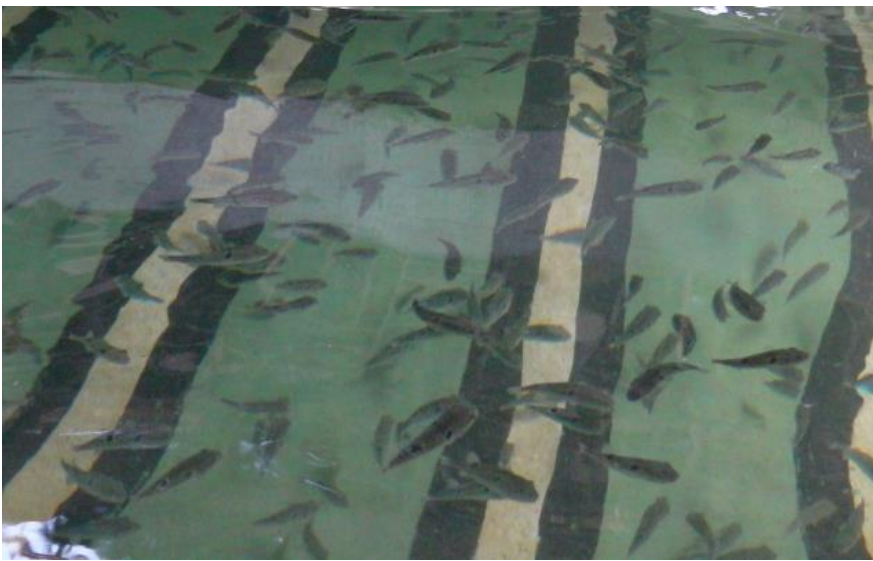
水槽内のトラフグの稚魚