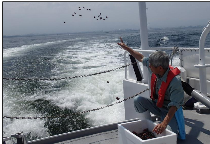
昨年度の放流の様子