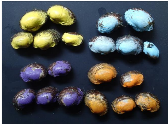
標識を付けたアカガイ種苗