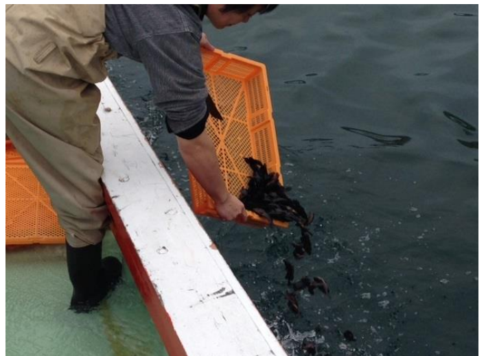
キジハタの放流風景