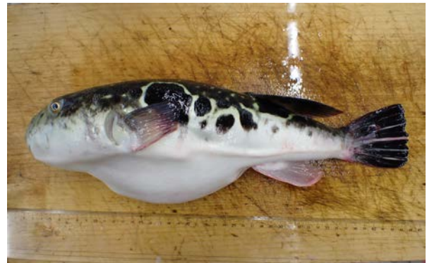
漁獲された放流トラフグ(2024年3月漁獲) (全長40センチメートル、1,392グラム、 2022年7月放流由来)