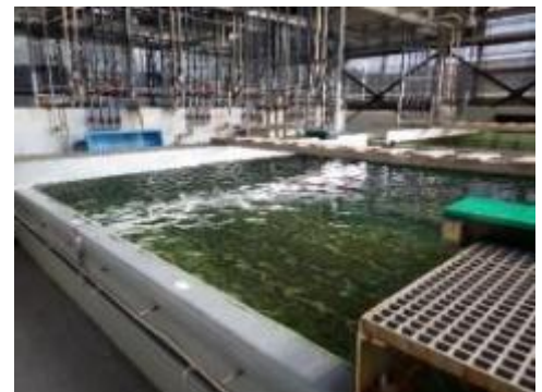
トラフグの飼育水槽

大阪産(もん)トラフグが府民のみなさまの食卓に届くことを期待し、さらに調査をすすめていきます。