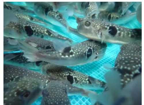
放流を待つトラフグの稚魚 全長70ミリメートル、体重8グラム程度

水産技術センターは放流の技術的サポートを行っており、トラフグの稚魚に大阪府から放流したことが分かるように頭の中にある耳石という硬組織を染色して目印をつけ、関係各県と連携して移動経路や成長を調査しています。初夏に放流したトラフグ稚魚は、翌年の1月頃には全長25センチメートル、体重300グラム程度まで成長して大阪湾で漁獲され始めます。これまでの調査では放流から1年半後に全長40センチメートル、体重1,392グラムに成長した個体も確認されました。また、大阪府から放流した個体が、瀬戸内海の西部海域でも漁獲されていることが確認されています。