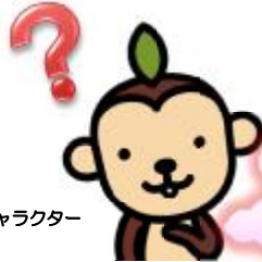
大阪府エコアクションキャラクター キットちゃん

大阪府立環境農林水産総合研究所では、中小事業者の省エネルギーの取組支援を通じて温暖化対策を推進する 省エネ・省CO 2 相談窓口 で、ご相談をお受けしています。