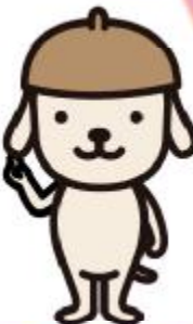
大阪府エコアクションキャラクター モットちゃん

省エネ・省CO 2 の取組は、 企業の経営コスト削減 にもつながり、きっとメリットがあるはず！ ぜひ、お気軽にご相談ください。